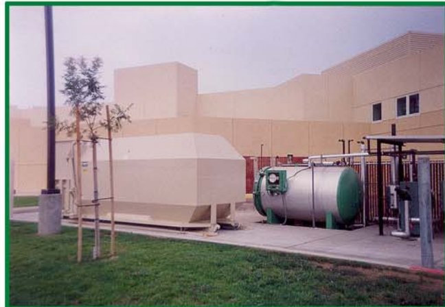
安装了自控压缩器，这家著名的西部医院使用 AS510 型进行固体和医疗废品的管理