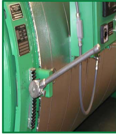
方便的门环开启，锁定齿轮杆