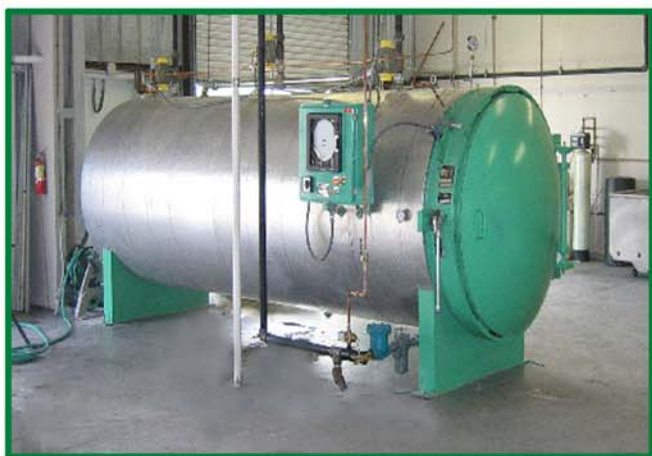
为了处理大量的医疗废品，这家东南部的废品处理机构使用了 AS515 型