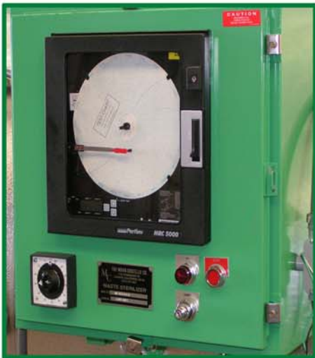
U.L.标记的数位记录仪 (可选择电脑控制)