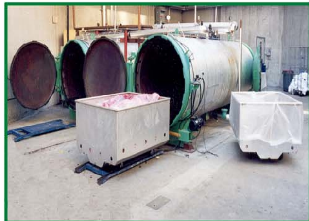
一家大的加州医院使用了双门的 AS515 型，符合了废品处理设备的可靠要求