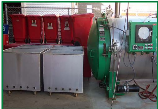
安装了液压门锁装置，这家东部的大医院使用 AS47 型进行现场废品处理的全部管理