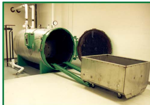
这家医疗中心使用了配有装卸车旋梯的 AS510 型，使装卸车能容易地进入消毒器内

AS-系列消毒器 THE MARK-COSTELLO CO. 1145 E. DOMINGUEZ ST. CARSON, CA. 90746 USA