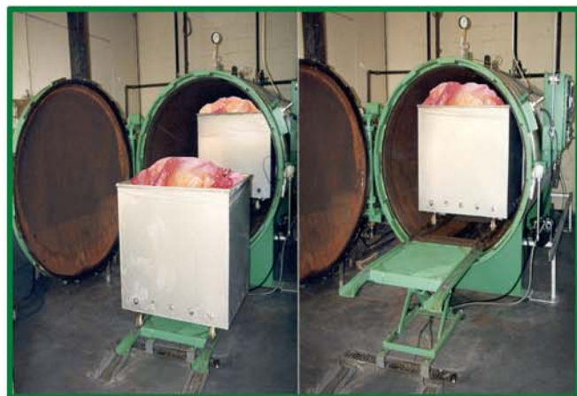
这家中西部医院使用 AS58 型，进行液压自动装卸，简化了废品处理程序