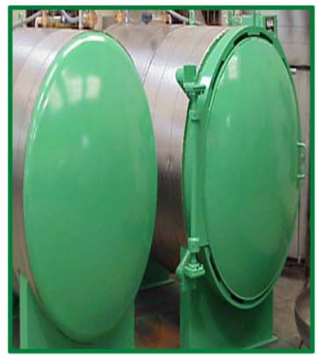
安装前，后保护板的全隔绝容器