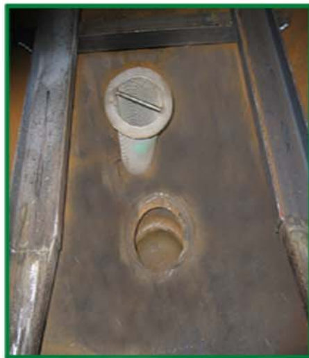
前排水管内部不锈钢滤网