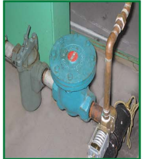
冷凝总成; 容易进入的蓝式滤网 / 蒸汽瓣 / 冷凝冷却剂